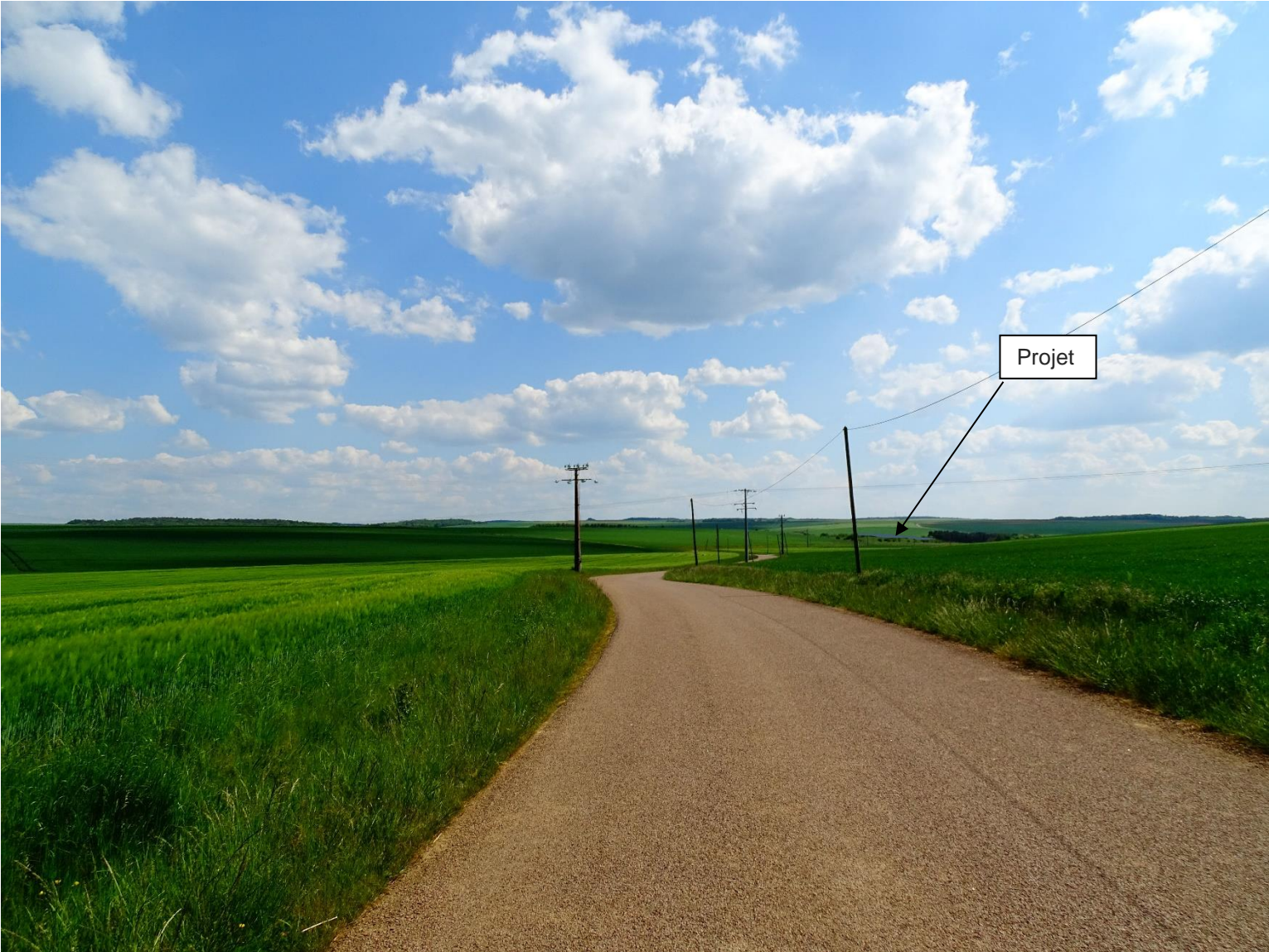
PC 6 – Lagesse – "La Haie Brunau" – Insertion du projet de construction dans son environnement