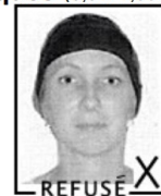
Sans foulard, serre tête ou bandeau Visage bien droit