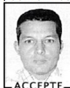
Dents non visibles Bouche fermée