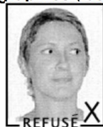
Regard de face Visage bien droit