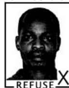
Photo ni sombre, ni tachée, ni coupée