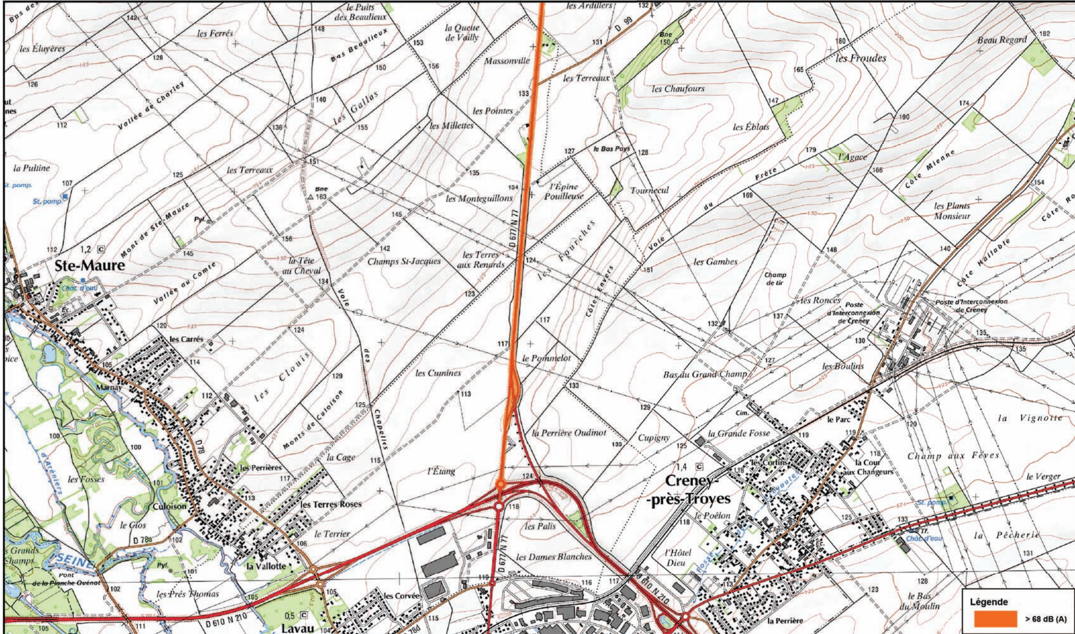
Carte de Bruit Stratégique (2ème Echéance) Carte de type C - Indicateur Lden (Jour, Soir, Nuit)

Carte de type C présentant les zones susceptibles de contenir des bâtiments dont le Lden (Level day, evening, night) dépasse 68 dB (A)