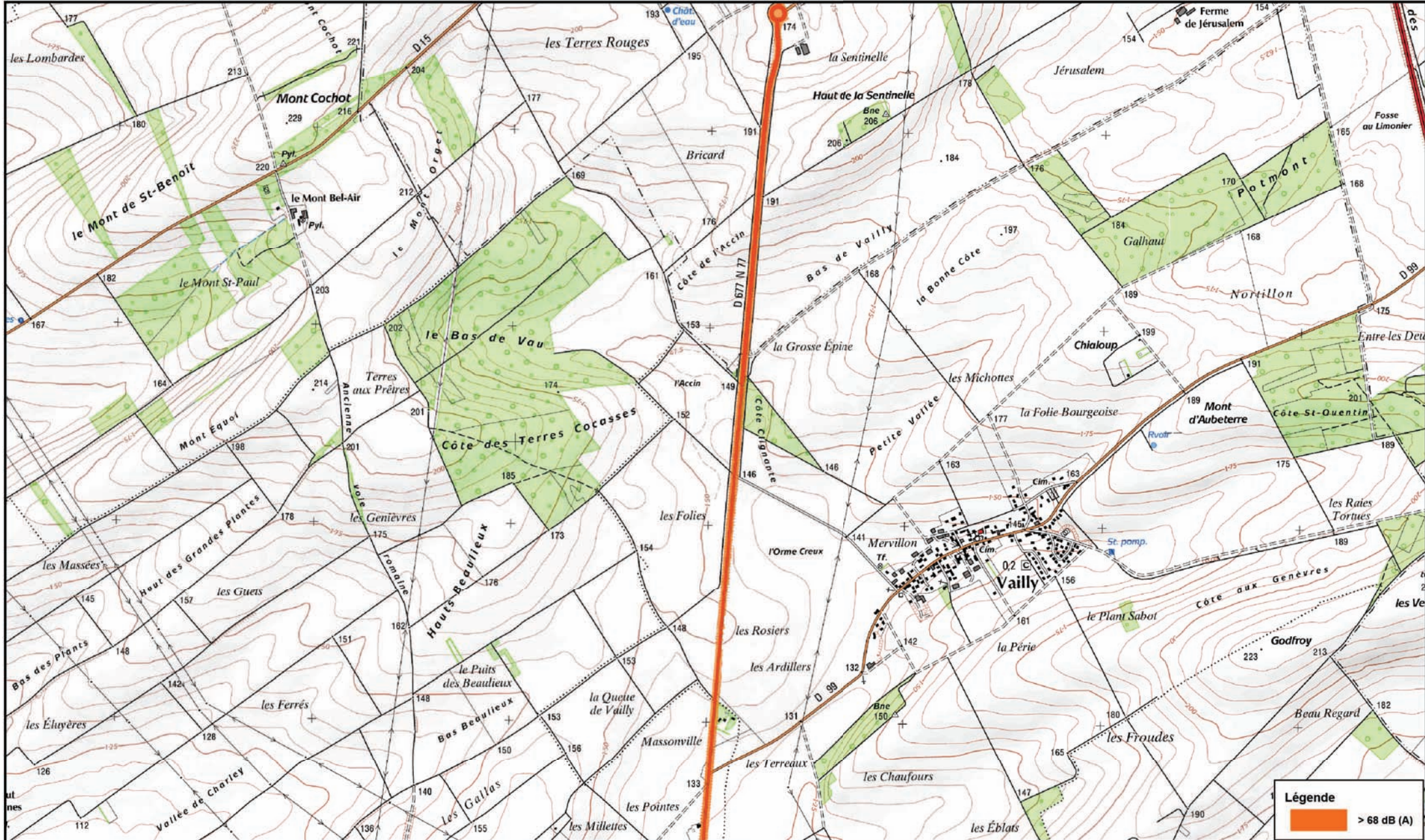
Carte de Bruit Stratégique (2ème Echéance) Carte de type C - Indicateur Lden (Jour, Soir, Nuit)

Carte de type C présentant les zones susceptibles de contenir des bâtiments dont le Lden (Level day, evening, night) dépasse 68 dB (A)