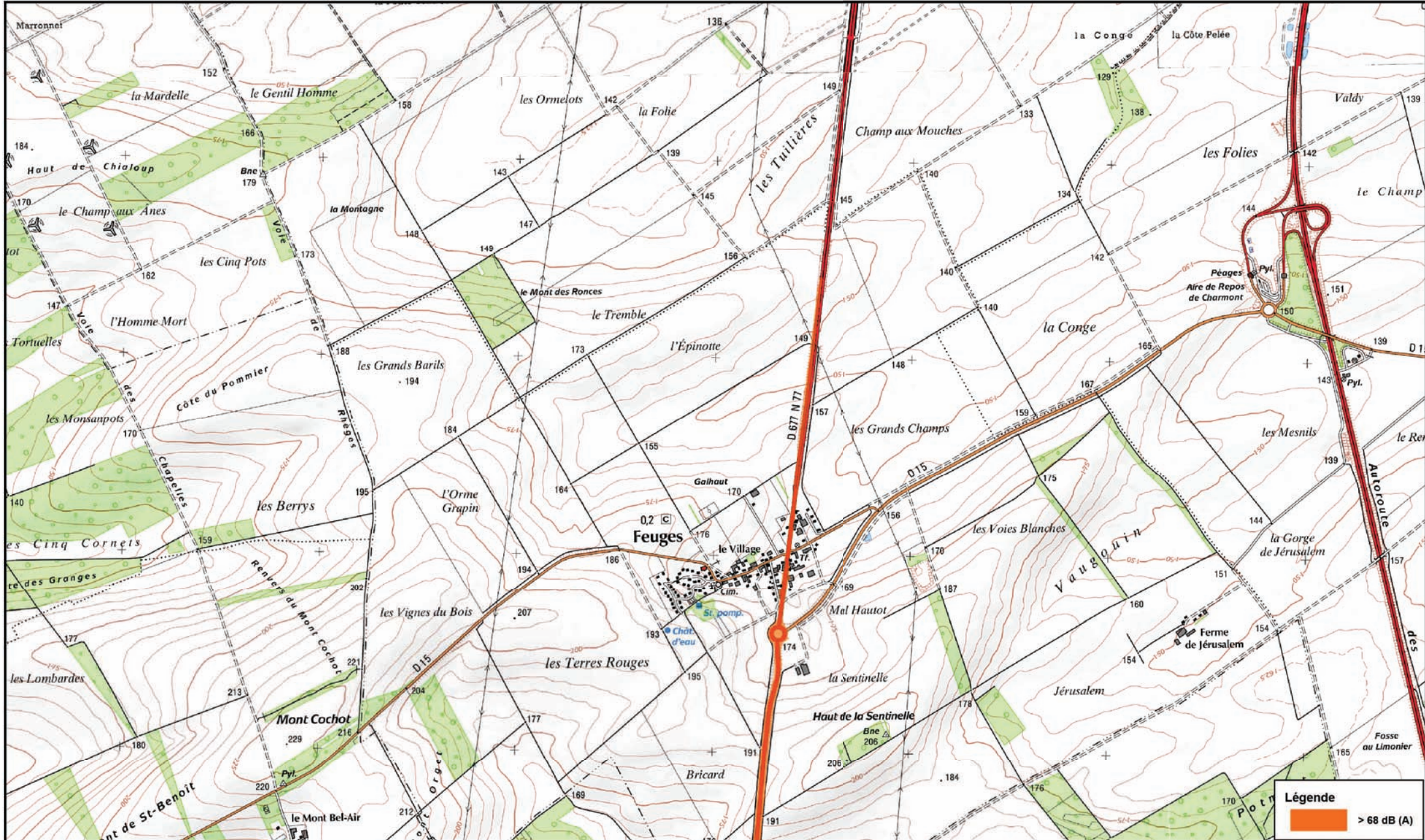
Carte de Bruit Stratégique (2ème Echéance) Carte de type C - Indicateur Lden (Jour, Soir, Nuit)

Carte de type C présentant les zones susceptibles de contenir des bâtiments dont le Lden (Level day, evening, night) dépasse 68 dB (A)