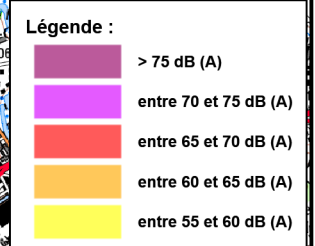
Carte de Bruit Stratégique (2ème Echéance) Carte de type A - Indicateur Lden (Jour, Soir, Nuit)